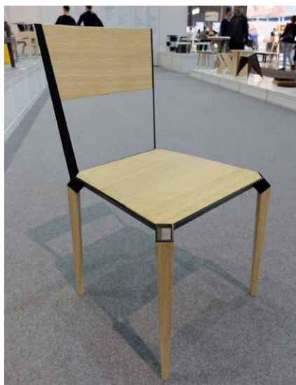
Židle Chair No. 2, zhotovená z oceli a masivního dubu, využívá nekonvenční spojení všech dřevěných dílů pomocí jedné kovové konstrukce

Možnost prezentovat svoji tvorbu a porovnat ji s „konkurencí“ v rámci studentské sekce soutěže GRAND PRIX MOBITEX letos využilo 83 studentů z 1 slovenské a 6 českých středních a vysokých škol, kteří přihlásili celkem 79 prací. Z těchto exponátů vytvořili pořadatelé speciální výstavu na veletrhu MOBITEX 2016 , kde je hodnotila odborná komise. Ta ocenila vynikající úroveň prací a doporučila pořadatelům udělit vedle 3 hlavních cen také 3 mimořádná ocenění. Celkem pak bylo dne 21. 4. 2016 uděleno 13 ocenění.