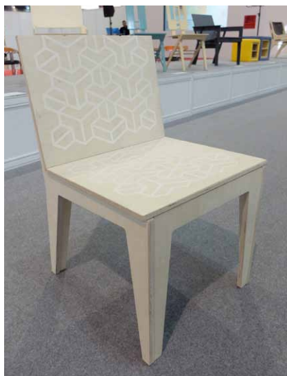
Na první pohled nekomfortně vypadající židle Ron překvapí svojí pružností a pohodlností. Pružný sedák a opěrák jsou vyrobeny z překližky profrézováním a následným spojením trvale elastickým lepicím tmelem

Autor: Radomír Čapka Kontakt: radomir.capka@gmail.com