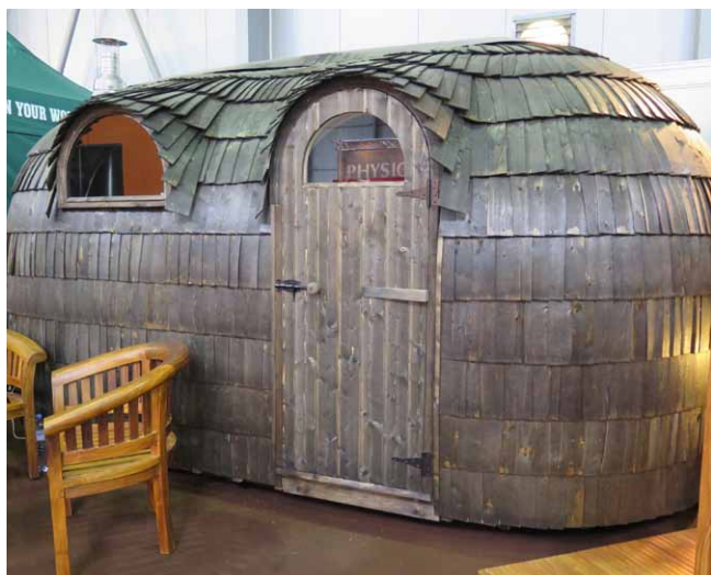
Exteriér a interiér severské iglú sauny společnosti Kylpyla, pokryté ručně štípaným šindelem

difúzně otevřený panel GOOPAN PLUS o rozměrech 1250 x 2800 mm, jehož konstrukční základ tvoří 160 mm široký dřevěný rám vyplněný minerální tepelnou izolací. Tento rám je zvenčí opláštěn sádrovláknitou deskou, na kterou se po montáži aplikuje přídatná tepelná izolace a fasádní perlinková omítka nebo odvětrávaná fasáda. Vnitřní opláštění nosného rámu panelu tvoří parobrzdná fólie, přecházející až do boční plochy, na kterou pak přímo navazuje rám montážní předstěny (s připravenými prostupy pro instalace) vyplněné tepelnou izolací opláštěnou sádrovláknitou deskou. Tyto panely jsou vzájemně spojovány pomocí speciálních zámek a umožňují tak montáž obvodových stěn ve dvou lidech. Na veletrhu si přišli na své také milovníci grilování a saunování. Mezi jinými např. v expozici kolínské společnosti Kylpyla, která zde představila originální finské grilovací a saunovací KOTY (dřevěné stavby kruhového typu s centrálním ohněm). Mimo nich i další provedení finských a lotyšských saun (sudové sauny, iglú sauny, Ruská banya aj.) vyrobené ze severského smrku a sibiřského modřínu. ■