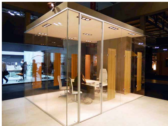
Akustické prvky doplňují prosklený jednací prostor