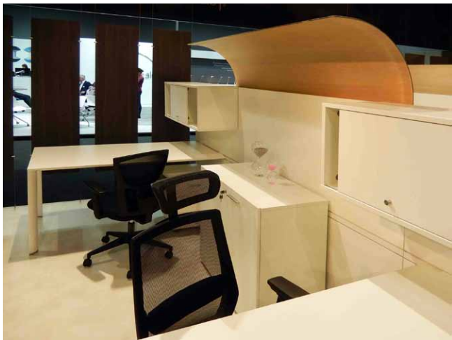
Akustický zaoblený prvek doplňuje kancelářský systém Trés firmy Mascagni