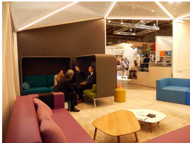
Jednací boxy firmy Aresline