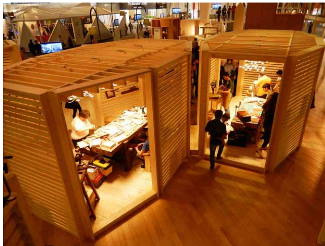
The Walk – Laboratoře představují dílny s tradičními řemesly i aktuálním 3D tiskem