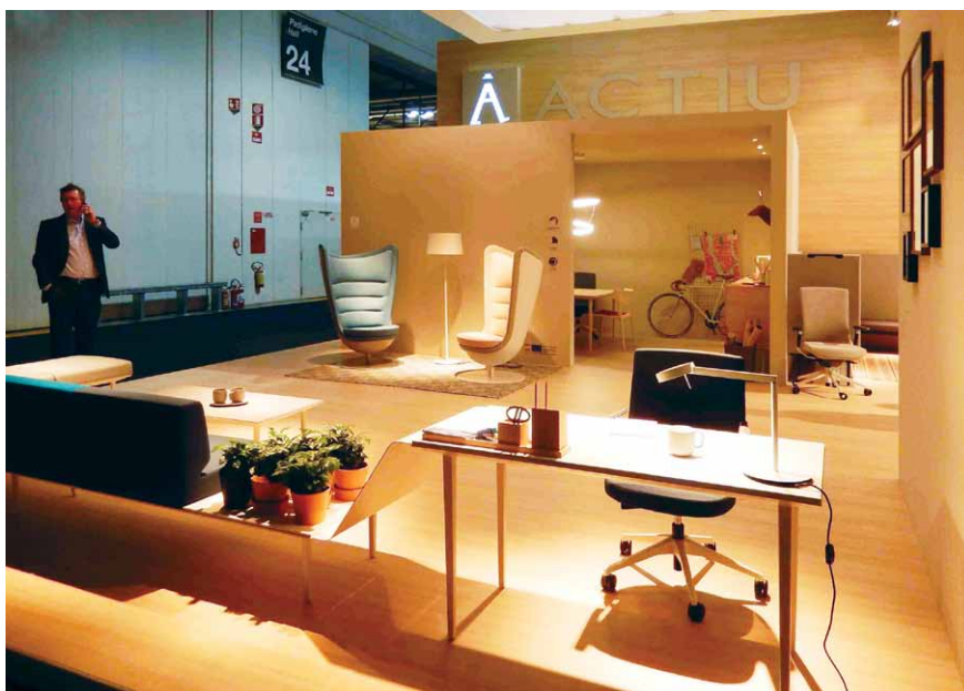
Kancelářský nábytek s retro prvky rakouského výrobce Actiu