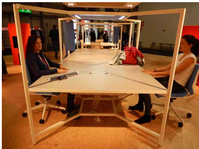
Modulární systém Hub firmy Fantoni