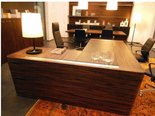
Manažerský stůl Zenith firmy Quadrifoglio