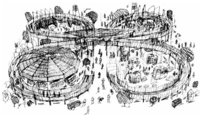
Agora of The Walk