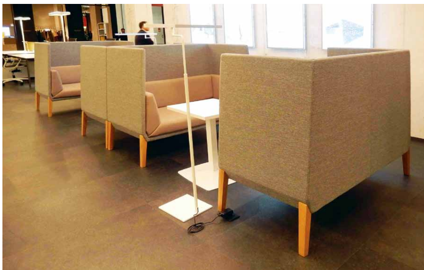
Jednací boxy firmy OffiSIT

Anglická firma Boss Design vystavovala jednací stoly doplněné předělovacím akustickým panelem se zabudovanou TV pro prezentace. Anglická firma The Senator Group přinesla do Milána prostorové pracovní boxy pro jednotlivce. Rakouská firma Actiu prezentovala hovorová retro křesla Bedminton a kancelářský systém Longo se zajímavou návazností stolů na prostorové sezení. Španělská firma Inclass předvedla návštěvníkům subtilní elegantní sedací nábytek. Vedle významných domácích a světových značek na výstavě prezentovaly své výrobky například český LD Seating, polský Nowy Styl nebo ruská Nayada.