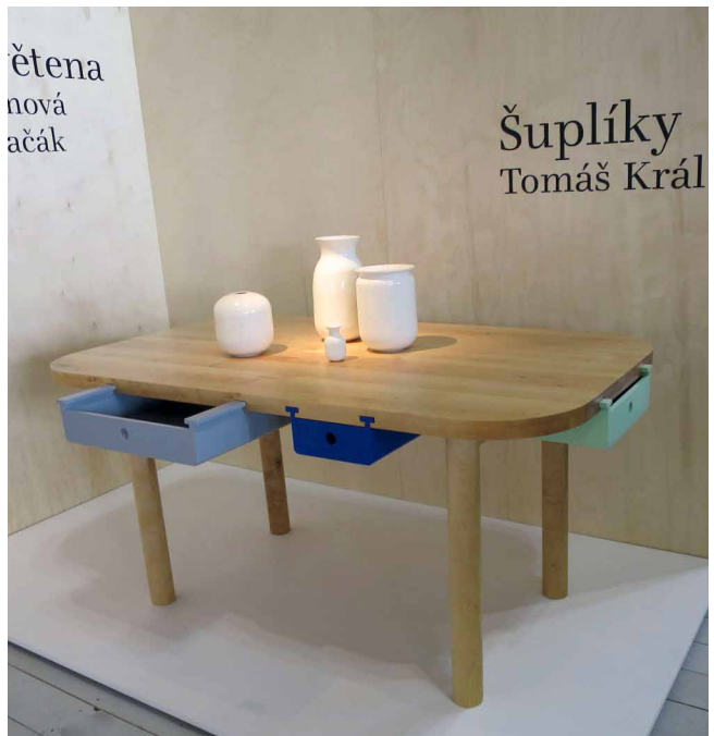
Šuplíky Tomáše Krále