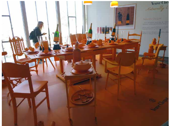
Expozice Veve Cliquot