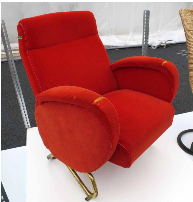
Křeslo pro italskou televizní stanici, Carlo Molino