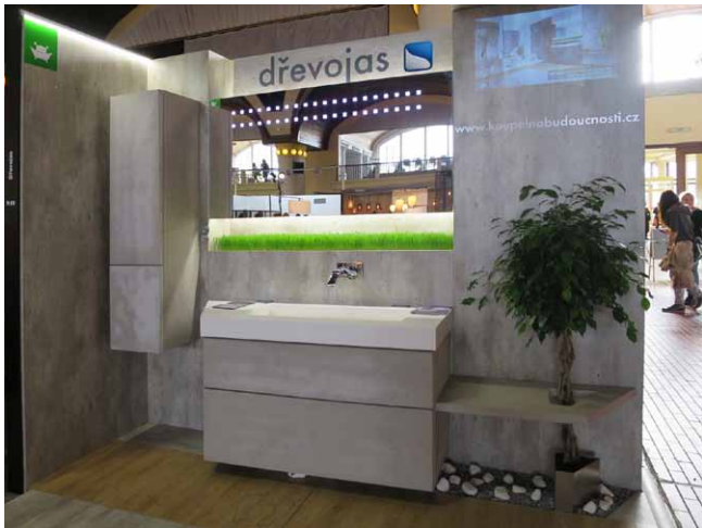
Koupelna roku 2025, Dřevojas