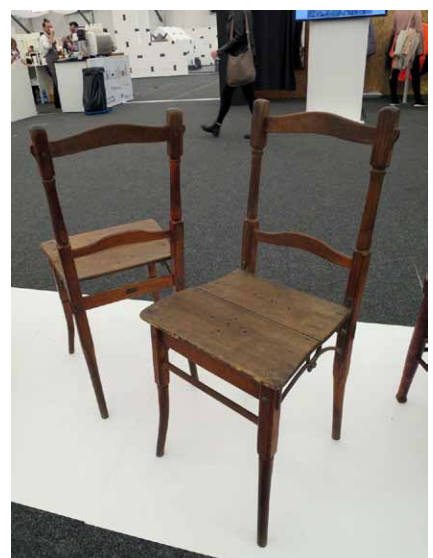
Reformní židle, Fryšták