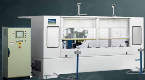
CNC stroj pre vŕtanie, pílenie a frézovanie úzkych dielcov