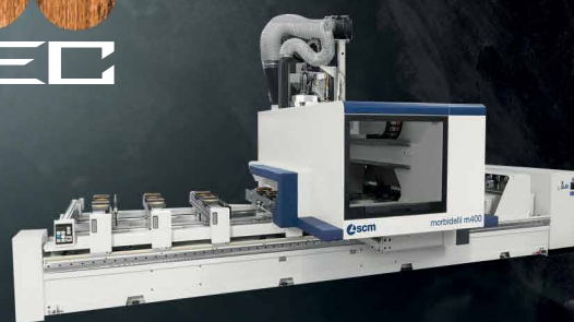
CNC 5-osé opracovanie