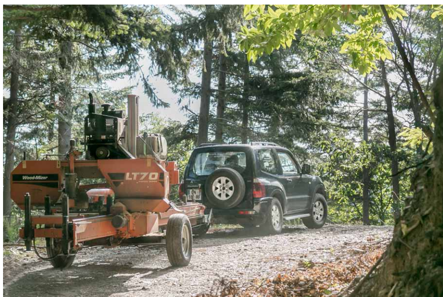
Mobilnú pásovú pílu Wood-Mizer ťahá automobil a môže sa prevádzkovať kdekoľvek, dokonca aj priamo v lese

Koncom sedemdesiatych rokov napadla dvom americkým vynálezcom jednoduchá myšlienka – prečo radšej nepriviesť pílu k stromom ako naopak? Zaujala ich možnosť ušetriť na prepravných nákladoch. Vo svojej garáži pracovali na niekoľkých prototypoch a po štyroch rokoch otestovali skutočnú mobilnú pásovú pílu. V roku 1982 založili firmu Wood-Mizer (šetrič dreva) s mottom – Z lesa do konečnej podoby (From Forest to Final Form) .