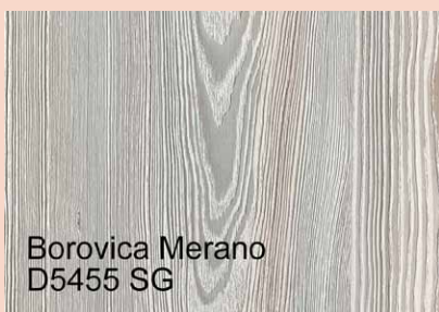
Borovica Merano D5455 SG

Výrobca: Emporio Skin Dodávateľ pre SR: IW Trend, s.r.o.