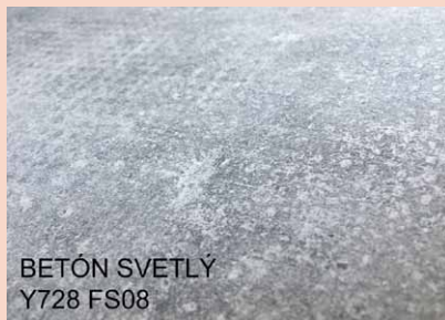
BETÓN SVETLÝ Y728 FS08