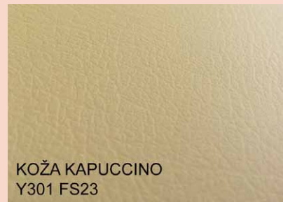
KOŽA KAPUCCINO Y301 FS23