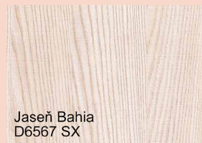
Jaseň Bahia D6567 SX