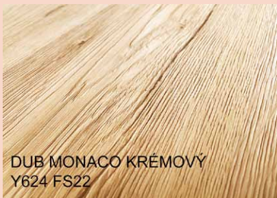
DUB MONACO KRÉMOVÝ Y624 FS22

Výrobca: Falco Wood Industry Dodávateľ pre SR: IW Trend s.r.o.