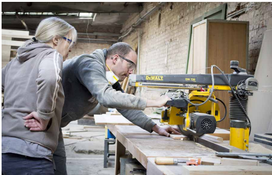
K osvědčeným marketingovým prvkům patří již 5. rokem pořádané paletové workshopy, oblíbené hlavně mezi ženami

(sdílená kancelář) pro pracující matky s dětmi. Tvořilo ji nábytkové vybavení pro cca 300 m 2 prostoru, zhotovované ve spolupráci s architektem investora, jehož výrobu bylo třeba zvládnout během necelých šesti týdnů respektive vikendů.