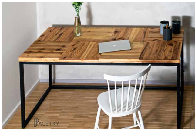
K častým zakázkám kromě postelí patří i různý stolový a sedací nábytek

říká nám při návštěvě firemní expozice MgA. Hana Krupová s tím, že po výše citovaném rozhodnutí následovalo několikaměsíční hledání takových palet, které by dostaly jejich ekologickým požadavkům.