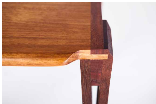
Při volbě „správných“ konstrukčních spojů lze z recyklovaných paletových přířezů vytvořit nevhední „designové“ kusy nábytku