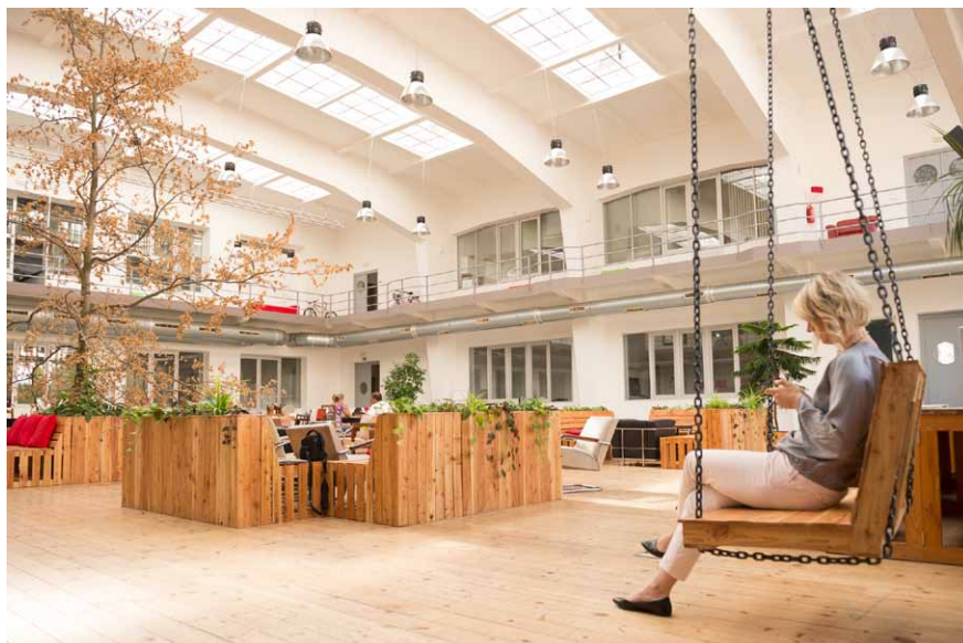
Problémem nejsou ani celkově zařízené interiéry či sauny