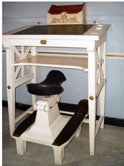
Psací stůl císaře Viléma II.