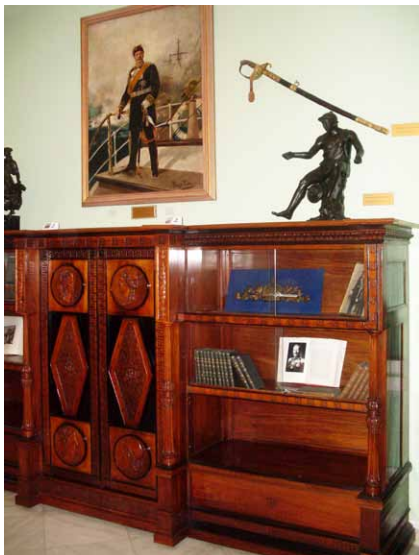
Císař Vilém II. nad knihovnou císařovny