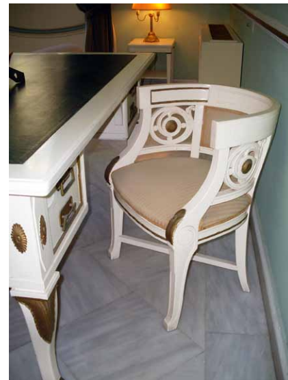
Psací stůl se židlovým křeslem

kaného tvrdého dřeva zdejší řemeslníci vyrábějí nábytek a suvenýry.