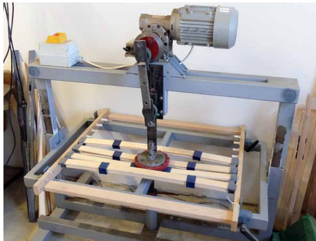
Kvalita vstupních komponentů je ověřována na vlastním zkušebním zařízení

DM: Co je hlavním předmětem vašich inovací?