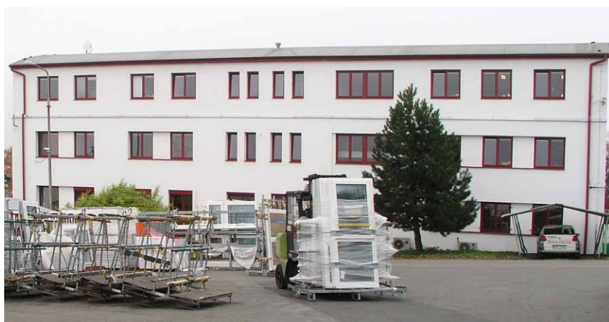
Okna pro potřeby koncernu ELK se v Plané n/L vyrábějí již 25 let ve stejných prostorech, ale od roku 2010 pod novou značkou WindowStar

V Plané nad Lužnicí působí již šestým rokem (od 4. 1. 2010) společnost WindowStar s.r.o. , patřící do koncernu předního evropského výrobce montovaných domů a srubů ELK Fertighaus AG. Zabývá se výrobou a montáží oken a vchodových dveří (dřevěných a plastových), které před tím od roku 1989 patřily do sortimentu druhé z tamních koncernových společností dnešní ELK s.r.o., která se od výše uvedeného data zabývá jen produkcí dřevěných montovaných domů (rodinných a bytových). Rozhodnutí rakouského vedení holdingu rozdělit výrobní program do dvou samostatně ekonomicky fungujících subjektů, kterým se i přes současné problémy na trhu daří postupně směřovat k naplnění vytýčeného cíle, se dnes po pěti letech jeví jako velmi prozřetelné.