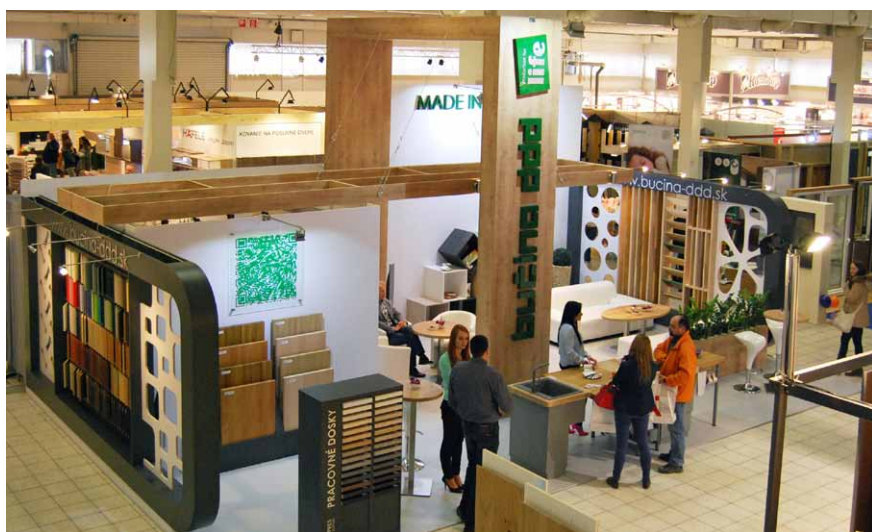
Expozícia spoločnosti Bučina DDD na veľtrhu Nábytok a bývanie 2015 v Nitre

Inšpirácia, ktorú Bučina DDD do Nitry priniesla, je jedným z príkladov ich dlhodobej spolupráce s Technickou univerzitou vo Zvolene. Návštevníci si mohli pozrieť prototyp variabilnej ostrovej kuchyne. Autorkou bola študentka TU Zvolen. Na vystavenom prototypu napr. ukázala využitie pracovnej dosky z lepeného masívneho dreva v štyroch samostatných blokoch.