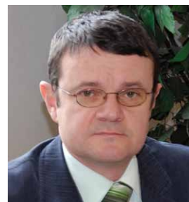
Autor: PhDr. Peter Zemaník Kontakt: peter.zemanik@zsd sr.sk

Na prvý pohľad bežné. Považujeme ich za samozrejmosť. Potrebujeme od nich pohodlie. Chceme sa nechať rozmaznávať príjemným zrakom i účelnosťou. Mnohokrát tvoria dominantu obývacieho priestoru. Ako spotrebitelia sme nároční pri ich výbere, chceme, aby sa nám páčili, aby boli pohodlné, trvácne, aby dlho vydržali, aby farebne ladili s interiérom, aby neprekážali, aby sa ľahko ošetrovali. Jednoducho – aby sa na nich (alebo v nich?) pohodlne sedelo.