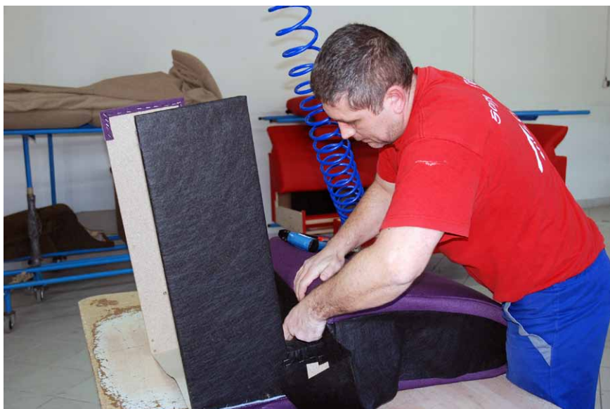
V aktuálnej ponuke GKT, s.r.o. je viac ako dve desiatky modelov sedacích súprav

„Kým na začiatku boli sedačky skôr také mohutnejšie, s hranatým korpusom a oblejšími tvarmi podpier rúk, bohatšie a komplikovanejšie aj v čalúnení, dnes mi viac vyhovujú skôr konzervatívnejšie, minimalistickejšie tvary a dizajn. Sú na jednej strane jednoduchšie, ale umož-