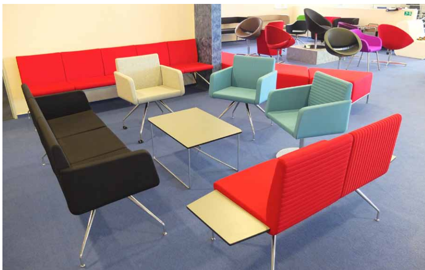
Vedle kancelářských židlí vyrábí firma také tzv. kontraktační sezení