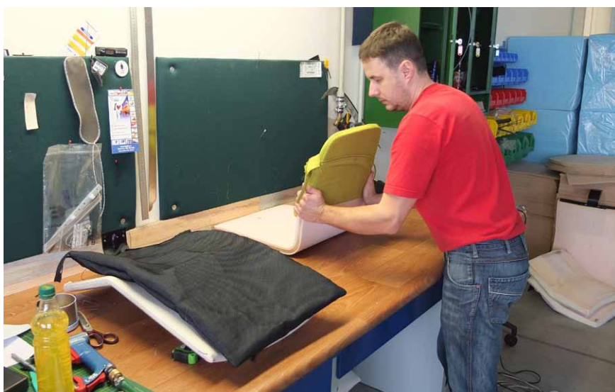
Nové návrhy si firma sama také vzoruje a vyrábí prototypy

Zhruba 90 % výrobků má šité potahy. Zručnost a šikovnost je proto rozhodujícím kritériem při přijímání švadlen