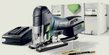
Hlavní výhra: přímočará pila PSC 420

Poznejte nové nápady systému Festool naživo a vyhraje!