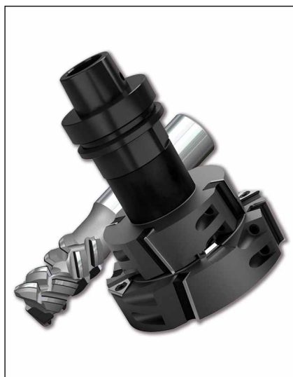
Nástroje do CNC strojů

Od roku 2012 se firma věnuje vývoji a výrobě nástrojů s PKD. Kvalita těchto nástrojů je zaručena jejich konstrukcí a špičkovou výrobní a kontrolní technologií. Jsou určeny k obrábění jak abrazivních (MDF, DTD...), tak stále častěji i masivních materiálů. Do této oblasti patří i novinka, kterou VYDONA vyrábí. Jde o systém diamantových nástrojů Mallard určený pro produktivní a vysoce kvalitní obrábění všech druhů dřev včetně tropických a materiálů na bázi dřeva jako DTD, MDF apod.