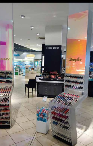
□ MS Hollywood

Svetový výrobca dizajnových interiérových fólií predstavuje 21 nových dekorov pre rok 2015