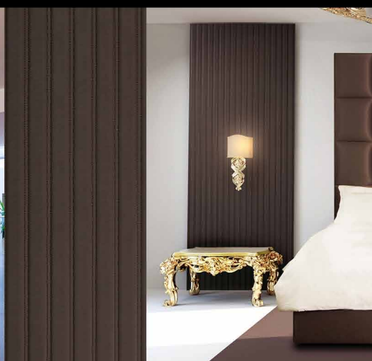
□ LL LOUNGE Mocca matt