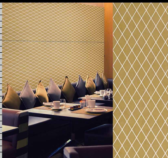
□ TL LINEA 104x62 Silent Gold