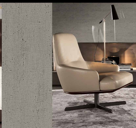
□ SG Old Platin AR+