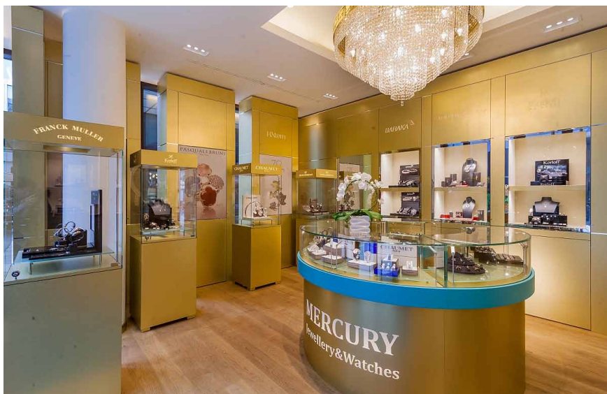
Mnichovskému klenotnictví dominuje zlatý HPL kovolaminát v kombinaci s kovolaminátem chrom-lesk, sklem, chromovanými prvky apod.

Interiér trnavského bytu s prolínajícími se různými styly, přírodními materiály a zemitými barvami s exotickými artefakty