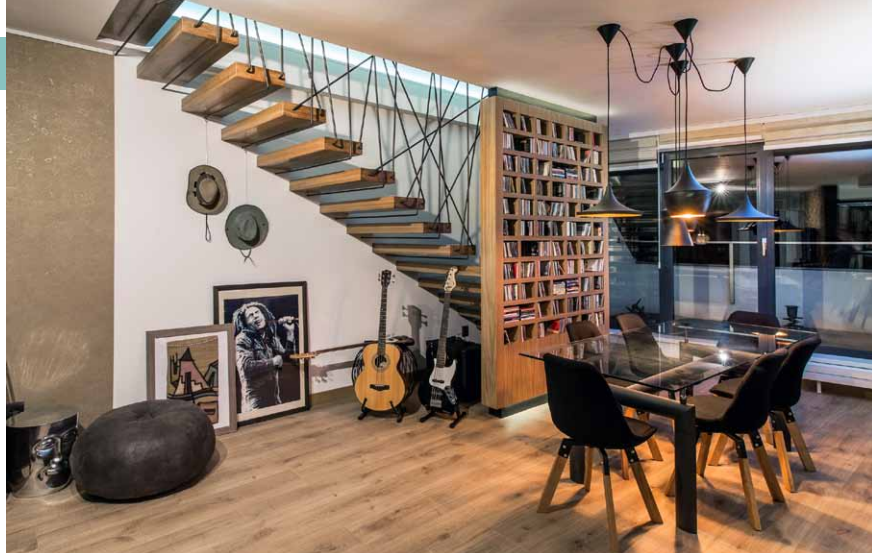
Další obrázky interiéru městského bytu v Trnavě