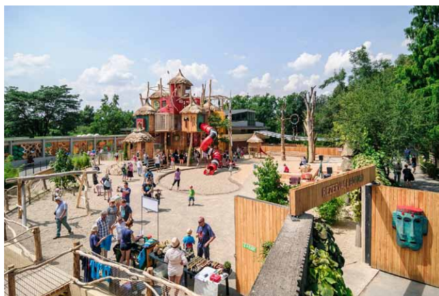
Velké dětské hřiště – Rezervace BORORO