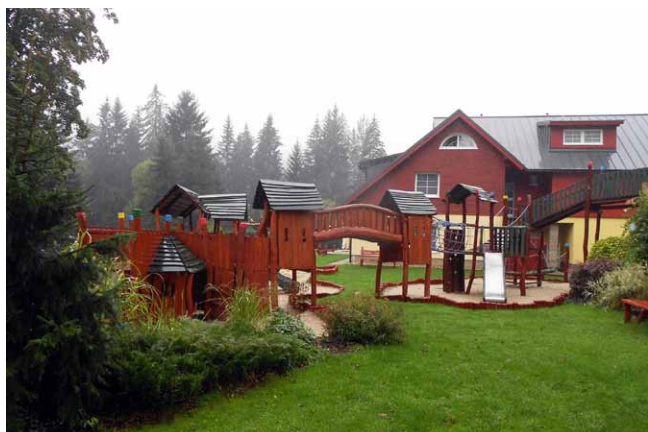
Malé dětské hřiště – Hrad UKO

Odpolední část programu, proběhnoucí ve Velkém rytířském sálu na černekosteleckém zámku, byla zahájena prezentací výsledků Národní inventarizace lesů v České republice (NIL2) provedenou Ústavem pro hospodářskou úpravu lesů Brandýs nad Labem. Od 15:00 hodin pak proběhlo vlastní vyhlášení výsledků DSR 2015, respektive osmi nejlepších soutěžních děl a jejich autorů (všešlych z veřejného hlasování 5. – 11. 10. 2015), kteří získali prestižní titul Vítěze vítězů Dřevěné stavby roku