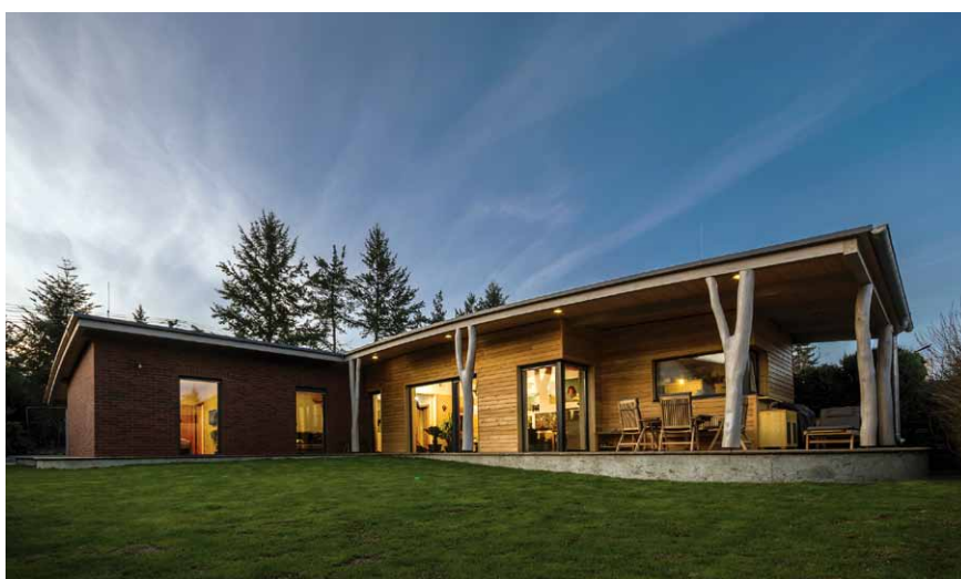
Dům inspirovaný lesem

bylo odesláno 13 867 hlasů, vzbudil opravdu nevědní ohlas, což nás velmi těší a také motivuje k neustálému zlepšování tohoto projektu do budoucna,“ doplnil Ing. Polák s tím, že od 1. listopadu 2015 spustila Nadace na svém webu nový přihlašovací systém pro další ročník DSR 2016 (na adrese www.drevopro-zivot.cz/prihlaseni-dila ) kde zájemci