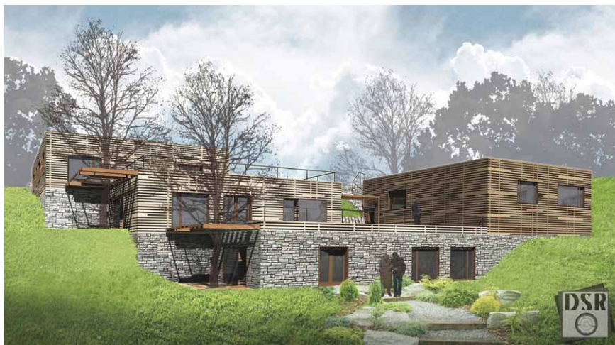
Návrh rodinného domu s kavárnou ve Znojmě