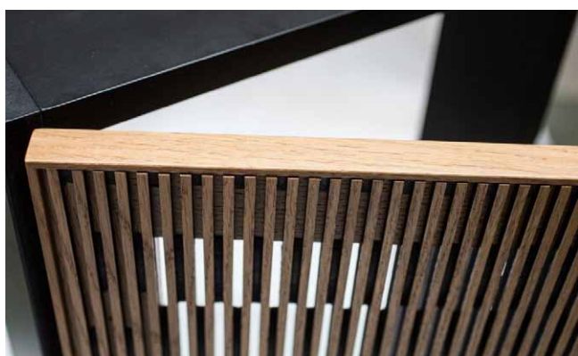
dukta® furniert – desky s dýhovaným povrchem