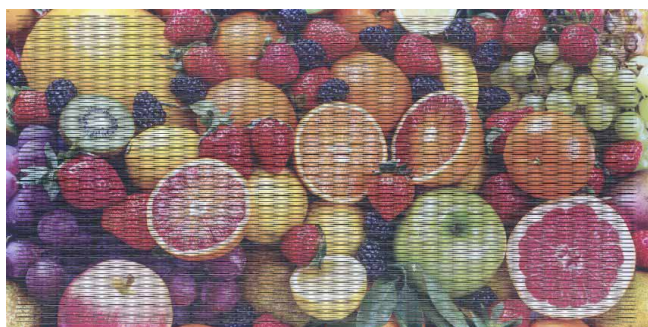
dukta® PRINT – desky s digitálním potiskem