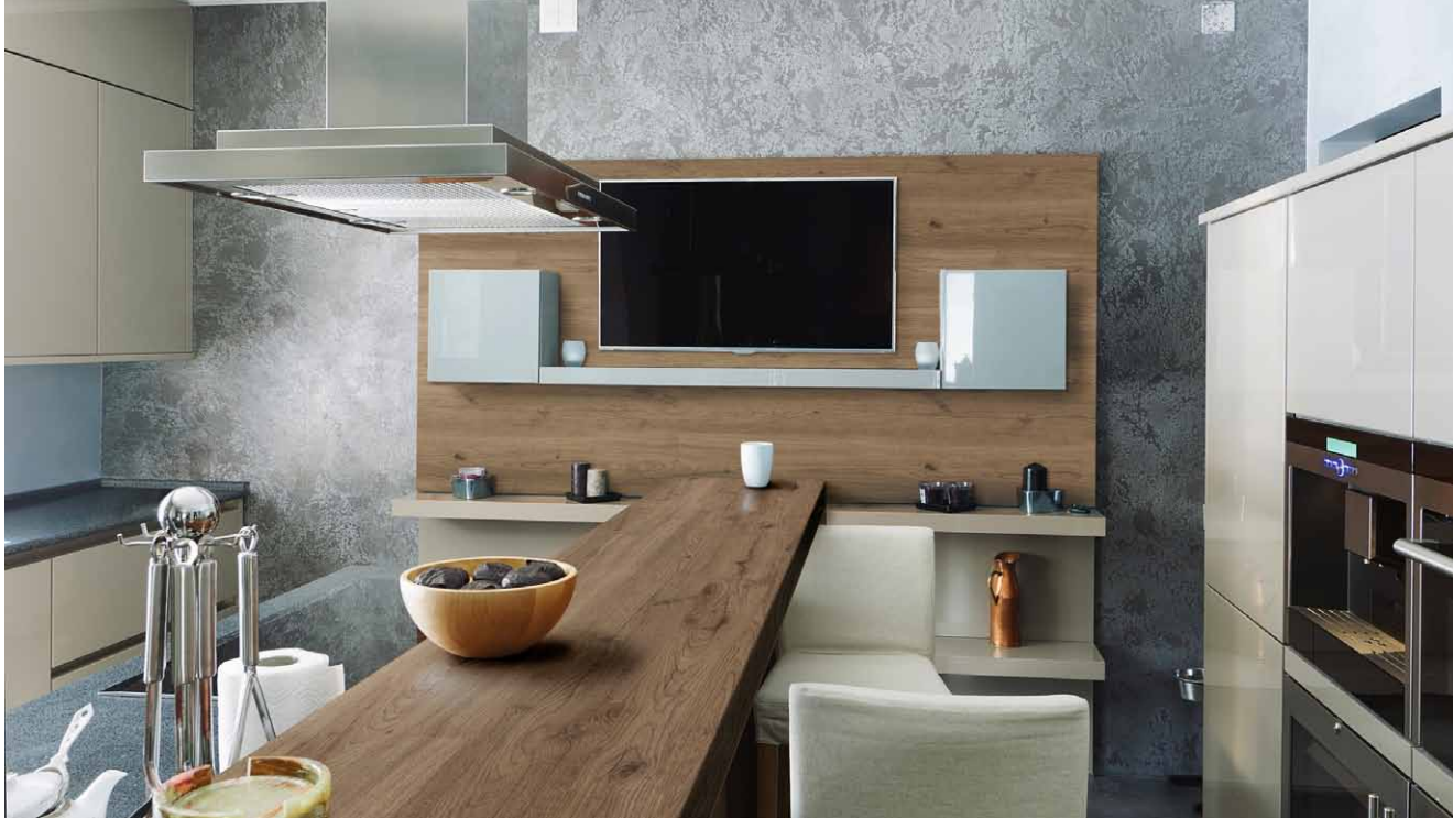
Ukázka řešení kuchyně s dekorem „Dub AMALFI“

Kombinace dřeva, bílé a šedé vytváří decentní a přesto útulný interiér, který i po zabydlení zůstává elegantní. Milovníci výraznějšího interiéru mohou zvolit dekory s výraznou strukturou dřeva a doplňovat interiér o prvky s barevnými akcenty v podobě velkých květináčů, váz či závěsů, aniž se ztrácí vkusnost řešení. Výhodou je, že obměna doplňků je cenově méně náročná než obměna celého interiéru a můžete si ji tedy dopřát častěji. A konečné řešení bude stále elegantní. Nároční zákazníci mohou nové dekory objednat také na deskách Lamino Plus, pro jejichž výrobu se používá výhradně čisté dřevo a mnoho truhlářů a zákazníků bude rovněž zajímat, že se jedná pouze o dřevo z českých lesů. Každá dodávka dřeva je pečlivě kontrolována, sledují se všechny základní parametry kvality dřeva, čímž je garantován trvalý a vysoký nadstandard materiálu. Desky LAMINO