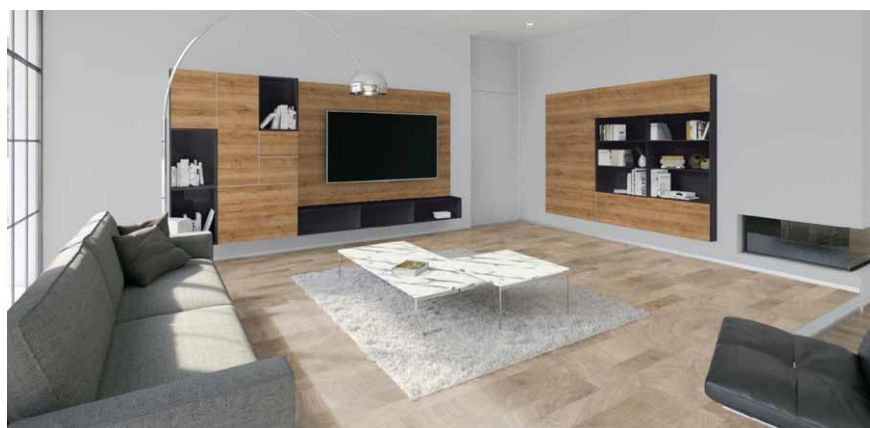
Ukázka řešení obývacího pokoje s dekorem „Dub MAHORN“

Kombinace dřeva, bílé a šedé vytváří decentní a přesto útulný interiér, který i po zabydlení zůstává elegantní. Milovníci výraznějšího interiéru mohou zvolit dekory s výraznou strukturou dřeva a doplňovat interiér o prvky s barevnými akcenty v podobě velkých květináčů, váz či závěsů, aniž se ztrácí vkusnost řešení. Výhodou je, že obměna doplňků je cenově méně náročná než obměna celého interiéru a můžete si ji tedy dopřát častěji. A konečné řešení bude stále elegantní. Nároční zákazníci mohou nové dekory objednat také na deskách Lamino Plus, pro jejichž výrobu se používá výhradně čisté dřevo a mnoho truhlářů a zákazníků bude rovněž zajímat, že se jedná pouze o dřevo z českých lesů. Každá dodávka dřeva je pečlivě kontrolována, sledují se všechny základní parametry kvality dřeva, čímž je garantován trvalý a vysoký nadstandard materiálu. Desky LAMINO