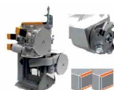
Agregát profilové cidliny

Tuto NOVINKU a více strojů naleznete na www.pilart.cz Navštivte také naše předváděcí centrum na adrese: