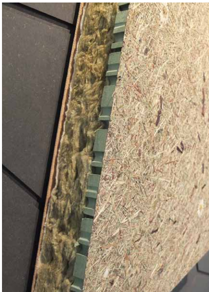
Detail akustického panelu ve spojení se zvukovou izolací