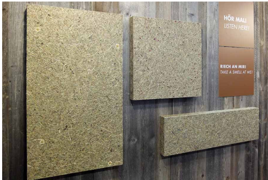
Dekoračním doplňkem zvyšujícím akustickou pohodu interiéru jsou obrazové absorbery

plné MDF desce a následně je v celé ploše profrézována systémem rovnoběžných úzkých drážek. Desky se vzájemně spojují na pero a drážku bez viditelného napojování ploch.