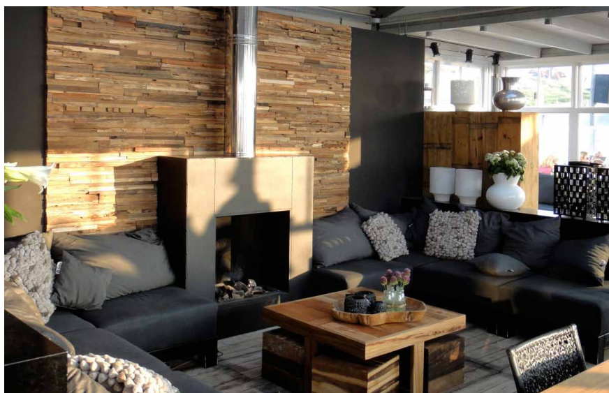
Ukázky různých aplikací Holandsko-indonéských obkladů v bytových interiérech a několika komerčních interiérech

část materiálu pro tyto obklady tvoří dřevo z kořenů padlých stromů a především pak odřezky dřeva s určitou růstovou či anatomickou vadou nebo jako v případě firmy SILVEKO oblinou, které by jinak sloužily jako palivo. Toto dřevo je zpracováváno v Indonésii místními řemeslníky do tvarů navržených holandskými designéry. Hotové jednotlivé profily daného typu obkladu se pak z boků a čel slepují do větších dílců zhotovených ve tvaru „Z“, ve kterých jsou (po impregnaci proti škůdcům a hoření) dodávány na trh, a z nichž se při vlastní aplikaci na stěnu vyskládá požadovaná velikost obkladu. Výroba je podle tuzemského zástupce firmy Davida Borovky z velké části prováděna ručně, a to především u typové řady Phoenix, kde některé z prvků každého dílce jsou zkrášleny ručně vyřezávanými ornamenty. Tomu pochopitelně odpovídá i vyšší cena těchto obkladů, pohybující se řádově od 4500 Kč do 8000 Kč/m 2 , přičemž k nejdražším patří právě řada Phoenix. Tento typ proto standardně nachází uplatnění zejména pro obložení interiérů komerčních prostor (hotely, restaurace), a to spíše v menších plochách o velikosti 3–7 m 2 . Montáž těchto obkladů spočívá v jednoduchém lepení dílců na stěnu. ■