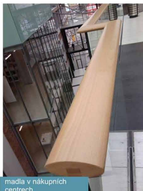
madla v nákupních centrech