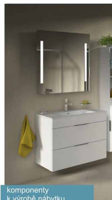
komponenty k výrobě nábytku