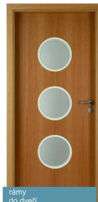
rámy do dveří