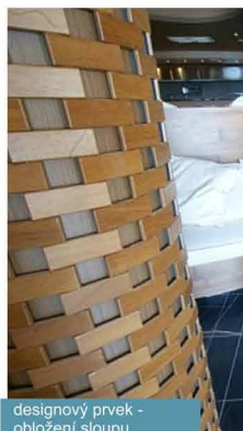
designový prvek - obložení sloupu