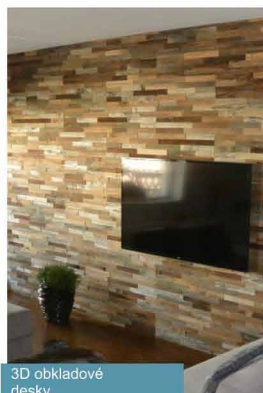
3D obkladové desky

BVV BRNO 20. - 23.10.2015 pavilon F, stánek č.020