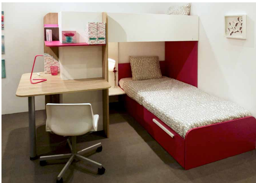
Zajímavým prvkem sestavy španělského výrobce je kombinace skříně a pracovního stolu