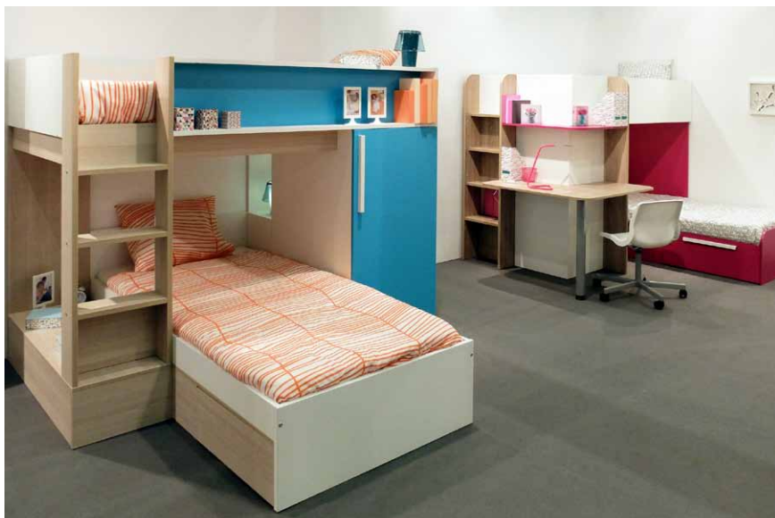
Kompaktní nábytkové sestavy firmy TRASMAN PENEDES s úhlovým uspořádáním lůžek

Druhá sestava španělského výrobce naopak je určena pro umístění do rohu. Spodní lůžko je proto přimknuté k jedné straně, zatímco druhá strana sestavy je řešena jako kombinace skříně a pracovního stolu. Úložný prostor skříně, přístupný ze strany spodního lůžka, je rozdělen svislou mezistěnou na dvě části. Jedna je uzavřena otočnými jednokřídlými dveřmi a druhá je otevřená a opatřená policemi, z nichž jedna je prodloužena a v podobě odkládací plochy vyběhá až k lůžku. Z vnější strany skříně ze dvou sousedních stran obepíná pracovní deska pravouhle zalomeného stolu, podepřená v rohu jednou válcovou nohou. Nad stolem je umístěna ještě pravouhle za-