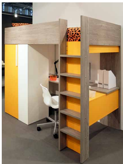
Dva způsoby využití spodního prostoru pod horním lžkem (TRASMAN PENEDES)

lomená police. Za stolem, v zadní části sestavy, je umístěn žebřík pro přístup na horní lžko.