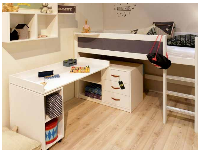
řešení spodního prostoru pod horním lžkem pomocí skříně a kovového modulu s otočnou výsuvným pracovním stolem (LIFETIME)

Prostor pod horním lžkem vybavený rohovou stolovou deskou a roztahovací lenoškou (Hoppekids)