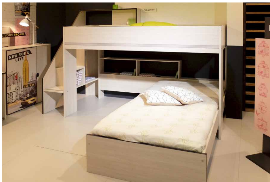
Jednoduché řešení patrové postele s úhlově uspořádanými lůžky (Parisot)