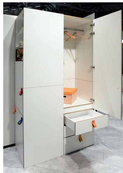
Multifunkční skříň „work/dress“ představuje šatník a pracoviště v jednom

Levá část skříně, dostupná z boku, představuje kancelářské pracoviště a je vertikálně rozdělena na tři sektory: horní otevřená knihovna, střední, dveřmi uzavřený úložný prostor a spodní úložný prostor. Horní a část středního prostoru je ve směru hloubky rozdělen svislou přepážkou (zády) na dvě části. Zadní část za přepážkou slouží jako prádelník a je dostupná z šatní skříně.