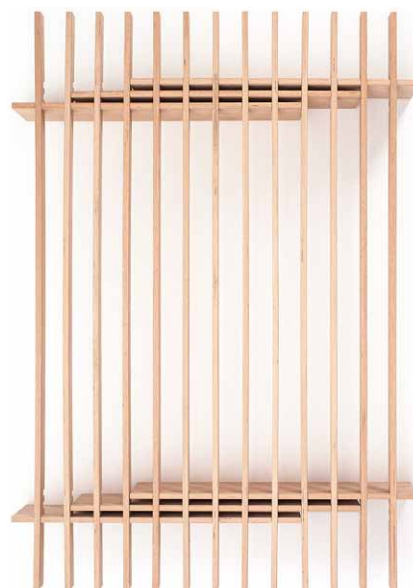
Základní varianta lůžka má šířku 100 cm. Posunutím podstavných desek vůči sobě a přidáním lamel můžeme lůžko rozšířit až na 200 cm