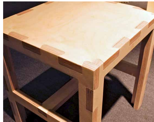
Konstrukční systém a způsob skládání připomíná 3D puzzle

rovou skládačku Origami. To má ale svůj účel. Kompaktní konstrukce, přestože je zhotovena z tenkých desek, nabízí při hmotnosti pouhých 2,3 kg vysokou tuhost a dobrou stabilitu. Židle je proto vhodná jako nábytek do bytových interiérů i do poloveřejných prostor. Oním bonusem, o kterém jsme se zmínili v úvodu, je v tomto případě snadná stohovatelnost, umožňující úsporné skladování.