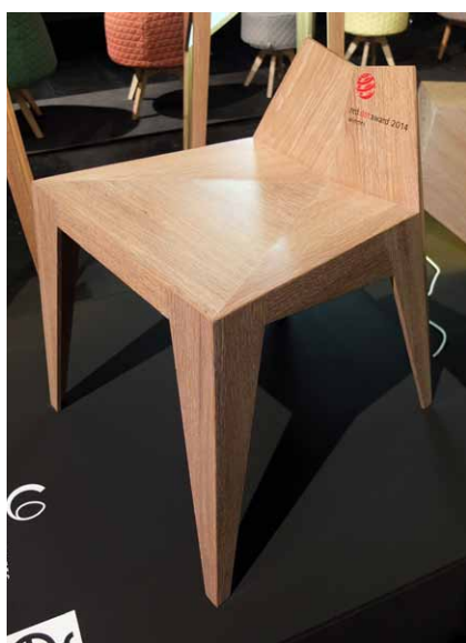
„Novokubistická“ židle Stocker

Kubismus v nábytkové tvorbě je jedním z českých fenoménů, které ve světě nemají obdoby. Z jeho odkazu dodnes čerpají i někteří současní designéři, a to nejen u nás, ale také v zahraničí. Do třetí části našeho seriálu o židlích, křeslech a sedátkách jsme zahrnuli jednu ukázkou „nového kubismu“ a dva pohledy na poněkud nekonformní sedací nábytek.