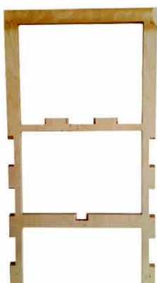
Židle #87 v rozloženém stavu