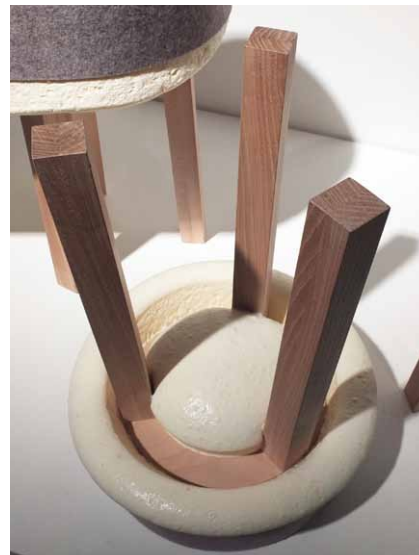
Stolička Swell vyrobená na principu „kynutí“

Na dalším obrázku je znázorněn postup při skládání židle, který připomíná sestavování trojrozměrné puzzle. Pro zvýšení komfortu sezení lze horní část opěradla obalit silnější plstí apod.