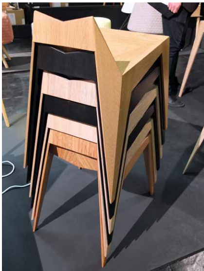
Dřevěná konstrukce, připomínající japonské origami, umožňuje stohování