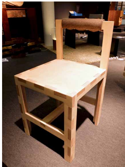
Skládací židle #87