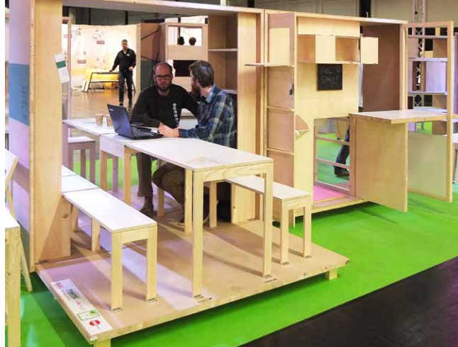
Jedním sklopným pohybem vytvoříme stůl s lavicemi

dulů je řešen jinak podle svoji funkce: spaní, ukládání šatstva, ukládání knih, šanonů apod., práce, setkávání, vaření, stolování, odpočinek. Funkce některých modulů se částečně duplikují (ukládání, práce, setkávání, stolování), některé moduly jsou vícefunkční (jedním z nich je např. jídelní stůl; otočením desky o 180° a rozložením připojené hrací plochy vytvoříme pingpongový stůl). Uživatel tak nemusí pořizovat všech osm modulů, ale může si vybrat jen některé z nich podle individuálních potřeb odpovídajících jeho životního stylu. Např. se čtyřmi základními moduly získá kuchyň, prostor pro stolování a posezení s přáteli, pracovnu a ložnici, a to včetně omezeného úložného prostoru.