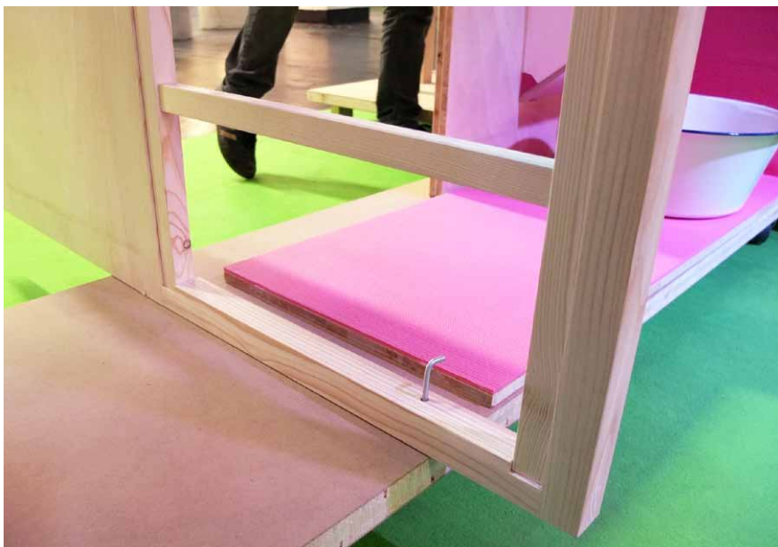
Zajištění otočného prvku pomocí kolíku