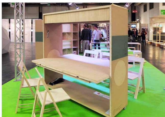
Dvoji funkce stolovacího modulu: z jídelního stolu otočením desky a rozložením hrací plochy vytvoříme pingpongový stůl