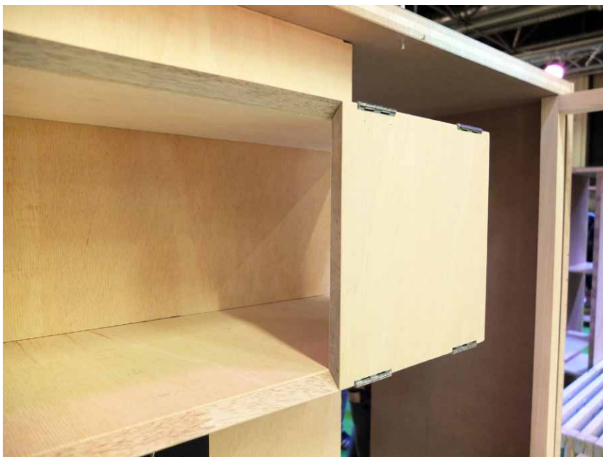
Detail otočných spojů