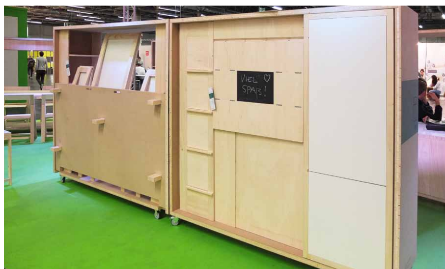
Vlevo modul společného sezení, který může sloužit k práci, ke stolování nebo k posezení s přáteli, vpravo modul vaření

Celý koncept tvoří osm modulů rámové konstrukce, které mají z logistických důvodů (kvůli snadnější přepravě) jednotnou unifikovanou velikost a kvůli snadnější manipulaci jsou opatřeny čtyřmi kolečky s brzdou. Jsou zhotoveny z vrstvených sendvičových desek, laťovek a smrkového masivu. Vnější rám tvoří korpus (box), v němž je promyšleně uložen nábytkový systém. Každý z mo-