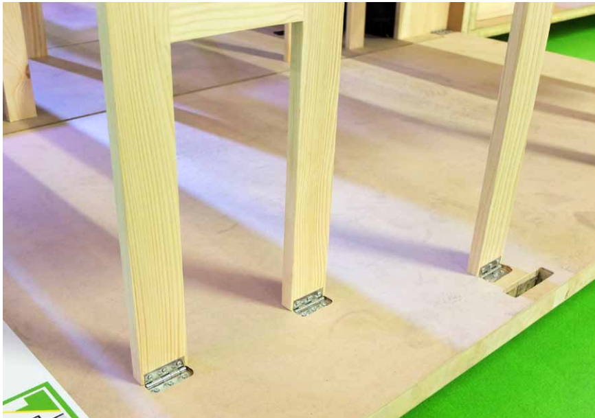
Detail otočných spojů