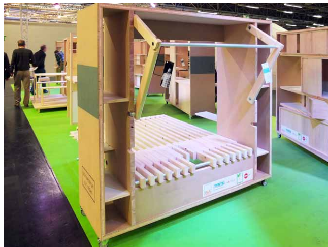
Modul pro spaní nabízí lůžko s pevným roštem