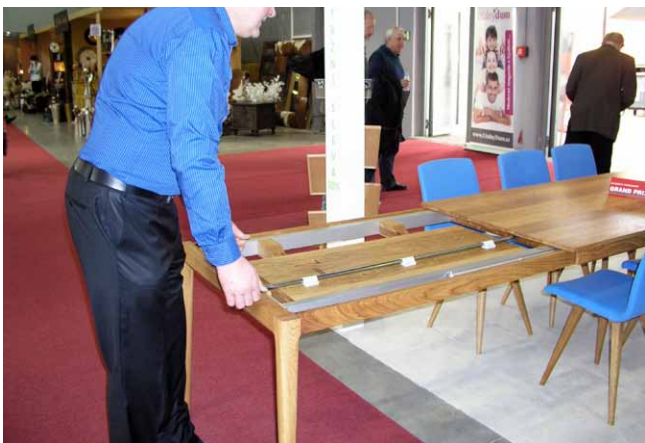
...umožňujícím zvětšit jídelní plochu (90x180 cm) prodloužením na 280 cm