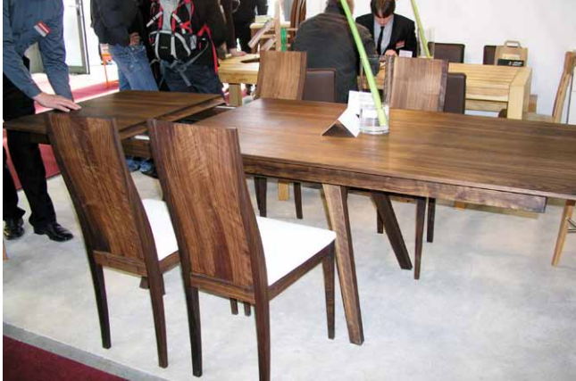
...zatímco nohy zůstávají bez pohybu, a utvoří uprostřed stolu prostor pro vložení přídatné desky uložené uvnitř stolu