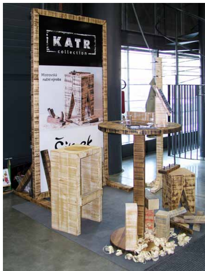
Letos v Brně prezentovaná KATR collection s „originálním“ povrchem vytvořeným záměrným narušením hladkého povrchu dřeva v příčném směru

u Veverské Bítýšky na Brněnsku, který je spolu s dvěma zaměstnanci prioritně zaměřený na zakázkovou výrobu nábytku z masivu a stavebně truhlářských výrobků. Svůj první designérský počín tzv. PASTELKOVÝ NÁBYTEK (sortiment nábytku a bytových doplňků s pastelkou jako ústředním motivem, použitou u nábytku např. pro nohy stolů, stolků, stoliček a postelí nebo jako rohové konstrukční prvky korpusů komod, skříní či knihoven apod.) představil veřejnosti v roce 2012 ve snaze rozšířit svoji činnost o malosériovou výrobu dětského nábytku. A to formou prezentace na několika veletrzích včetně podzimního veletrhu For Interior 2012 v Praze, kde tato kolekce zaujala i čtveřici architektů, což dalo autorovi do budoucna jistou naději na širší uplatnění tohoto sortimentu na trhu (viz DM 1-2/2013). K pozdější spolupráci s těmito architekty ale nakonec nedošlo a z kolekce Pastelkového nábytku, která se pro firmu stala pouze doplňkovou, se v současné době prodávají jen některé interiérové doplňky směřující do dětských pokojů, mateřských školek či lékařských ambulancí.