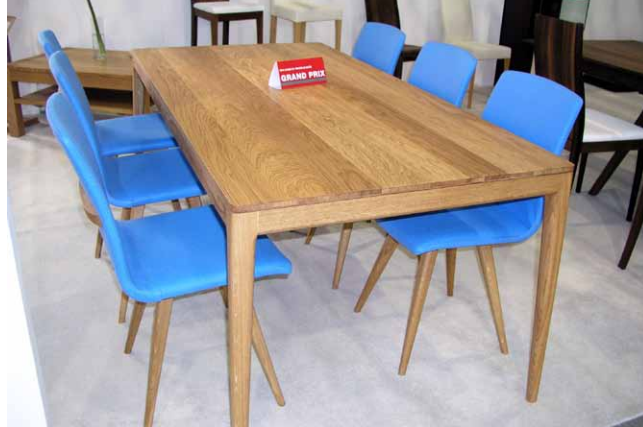
Loni úspěšný jídelní set GATTA (3. místo Grand Prix For Furniture 2014) s čalouněnými židlemi a subtilním stolem...