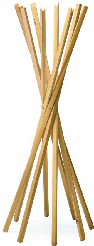
Sciangai vేశák, design De Pas D' Urbino-Lomazzi 1979, Compasso d'Oro. Jednoduchá struktura vzniklá stočením svazku masivních tyčí

a malované dekorace. Vznikají limitované číslované série, které budou postupně svoji hodnotu jenom zvyšovat. Někdy jsou karikaturou již obehnaného výrazu nebo jdou proti proudu. Proto jsou často citovány v odborných publikacích a zastoupeny ve významných světových muzeích jako je MoMA, Centre Pompidou, London's Design Museum, Vitra Design Museum Weil am Rhein či Izrael museum Jerusalem.