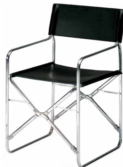
Skládací židle April, design Gae Aulenti, 1964, určena do exteriéru a na lodě

Kvalitu považuje Zanotta za srovnatelnou s designem. Dokonalé materiály a dokončení, zaměření na detail, funkčnost, komfort, bezpečnost a trvanlivost byly vždy charakteristickými rysy veškeré produkce. Firemní filosofie umožňuje výrobu jen takového zboží, které v průběhu užívání zachová původní kvalitu a řadu let je každodenním spolehlivým společníkem svého uživatele. Musí být pevné, lehce udržovatelné, vysoce funkční, ale i recyklovatelné a přátelské k životnímu prostředí. Kvalita produktů Zanotta je založena na systematickém výzkumu, dobré organizaci práce, důvěryhodnosti a spolehlivosti, ale i na postprodejním servisu. Úsilí o její průběžné zajišťování je závazek bez kompromisů. Aktuální výrobní kolekce zahrnuje skříně, úložné systémy, knihovny, pohovky, křesla, židle, stoly, stolky a nábytkové doplňky. Jsou k mání v 60 zemích. Prodejní síť je přizpůsobena lokálním požadavkům. Protože je firma od roku 1990 členem mezinárodního i italského institutu pro standardizaci, může vytvářet produkty v souladu s aktuálními normami, zejména ve smyslu ergonomie, bezpečnosti, odolnosti vůči ohni, vlíd-