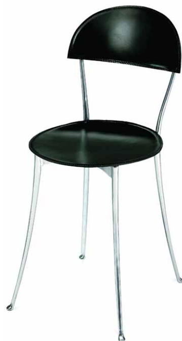
Tonietta Chair, design Enzo Mari, 1987, Compasso d'Oro. Konstrukce leštěný hliník, sedák a opěrák sedlářská kůže