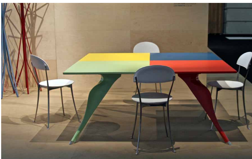
Stůl Fancy Macaone, design Alessandro Mendini, židle Toniotta a věšák Sciangai, Paříž 2012