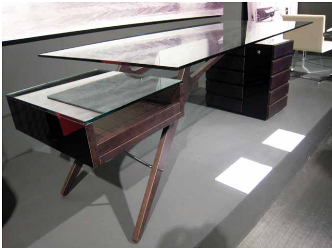
Pracovní stůl Cavour, design Carlo Molino, byl navržen v roce 1949 pro turínský dům Orengo. Zapadá do série erotických děl Molina, velkého svůdníka. Hraje si s kontrastem měkkých linií jasanového dřeva a tvrdých tvarů skla a zásuvkového bloku