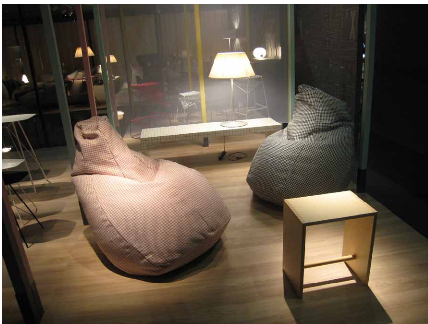
Famózní Sacco, design Piero Gatti, Cesare Paolini, Franco Teodoro, 1969. Jedna z firemních ikon charakterizující dobu svého vzniku, období Pop designu. V pozadí laminátový stolek Quaderna, design Superstudio, 1970. Forma křesla naplněného polystyrénovými kuličkami vzniká až v kontaktu s lidským tělem, prezentace na Pařížském salónu nábytku vyvolala tehdy šok. Původně bylo křeslo dokončeno koženkou, verze Milano 2014 předvedla textilii v dezénu pepito. V souladu s chápáním života jako permanentní party se do křesla neseďá, ale „háže“.