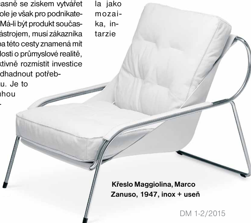
Křeslo Maggolina, Marco Zanuso, 1947, inox + useň

Na rozbřesk italského designu 70. let navázala v roce 1989 řada Zanotta Edizioni. Ta je zase více propojena s užitným uměním. Všechny produkty jsou vyráběny ručně a tak připomínají a ožívují opuštěné a kdysi proslulé techniky italského řemesla jako mozaika, intarzie