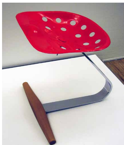
Mezzandro, design Achille Castiglioni, 1957, firemní ikona a vyhledávaný objekt muzejních sbírek. Nonkonformní sezení na plastovém sedáku z traktoru

a malované dekorace. Vznikají limitované číslované série, které budou postupně svoji hodnotu jenom zvyšovat. Někdy jsou karikaturou již obehnaného výrazu nebo jdou proti proudu. Proto jsou často citovány v odborných publikacích a zastoupeny ve významných světových muzeích jako je MoMA, Centre Pompidou, London's Design Museum, Vitra Design Museum Weil am Rhein či Izrael museum Jerusalem.