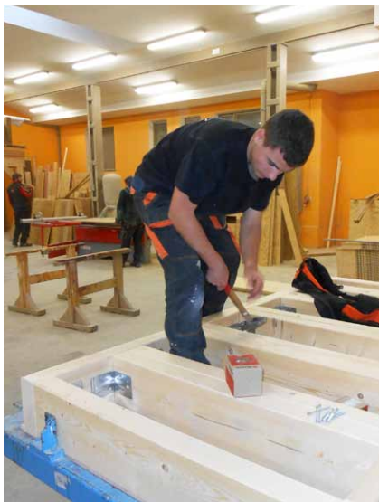
Stáž pre Technika drevostavieb v Písuku