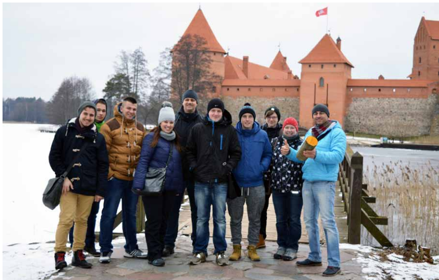
Návšteva ostrovného hradu Trakai počas stáže pre Technika drevostavieb a Stolára vo Vilniuse (Litva)

školských dielňach SOŠ a SOU Písek. Výmena skúseností s obsluhou CNC bola obojstranná. Stáž pokračovala na jar jobshadowingom našich učiteľov, ktorí si prišli vymeniť skúsenosti s duálnym vyučovaním a spoluprácou s firmami pri zabezpečovaní praxe študentov.